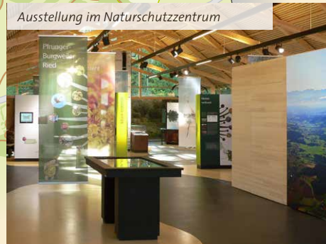
Ausstellung im Naturgeschutzzentrum